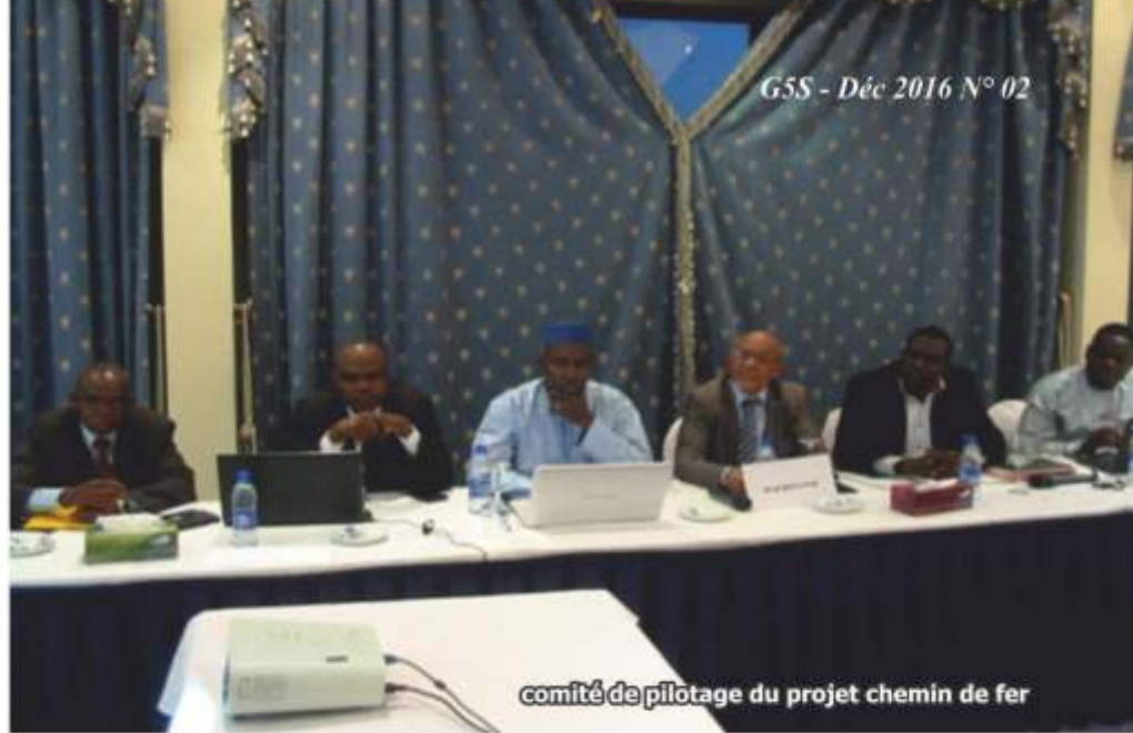
comité de pilotage du projet chemin de fer

Les acteurs concernés sont au premier chef les populations qui sont souvent liées de part et d'autre des frontières par des liens forts de parenté. Mais la suppression des frais d'itinérance contribuera aussi à la coopération transfrontalière au moindre coût entre les autorités et les acteurs de terrain des forces de défense et de sécurité, à l'heure où s'élaborent dans le cadre du Partenariat militaire de coopération transfrontalière (PMCT) des annuaires cartographiés qui faciliteront en pratique les échanges téléphoniques de part et