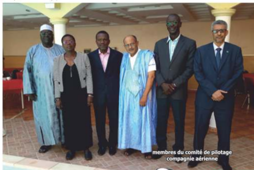
membres du comité de pilotage compagnie aérienne