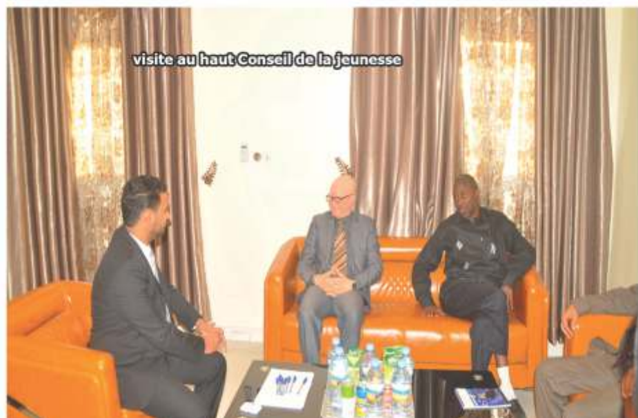
visite au haut Conseil de la jeunesse

R : C'est un constat d'espérance nous avons été écouté, il y a toute une fierté de la part de nos interlocuteurs du Monde