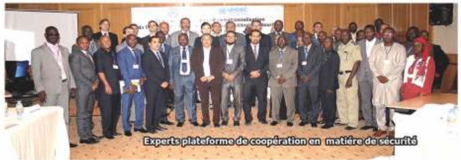
Experts plateforme de coopération en matière de sécurité

-L'harmonisation des procédures en matière de lutte contre la criminalité transfrontalière.