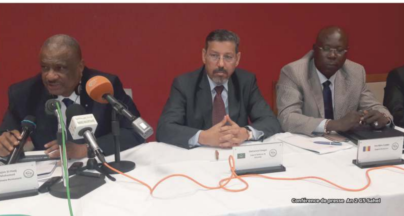
Conférence de presse An 2 G5 Sahel