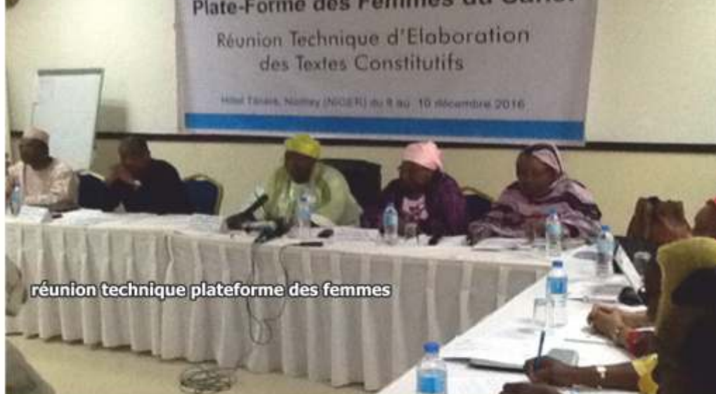
réunion technique plateforme des femmes

Ce processus de dé-radicalisation est conforme à l'appel lancé aux Etats par l'ONU, en vertu de la résolution n°1624 du 14/09/2001, pour cultiver la modération en poursuivant l'action menée pour " que les civilisations dialoguent davantage et se comprennent mieux afin d'empêcher le dénigrement inconsidéré des religions et cultures des autres ". En luttant contre la radicalisation, la législation nationale s'est conformée au droit international grâce à une approche préventive qui repose sur la nécessité d'une adhésion du citoyen aux principes religieux et moraux de l'islam. Ainsi, l'article 1 de la loi n°2010-035 du 21/07/2010 rejette " toute forme de dérive, fanatisme, prosélytisme religieux et apologie de la violence ". En se dotant d'une législation antiterroriste répressive, la Mauritanie s'est, également, inscrite dans l'approche onusienne contre la stigmatisation de la religion, exprimée dans la résolution n°60/288 du 09/09/2006 prêchant la modération en ces termes : " le terrorisme ne saurait, ni ne devrait être associé à une religion donnée, à une nationalité ou à une origine ethnique. " Dans une région, fortement, exposée aux défis de l'extrémisme, les stratégies nationales devraient intégrer la nécessité de traduire les convergences de vues à travers un plan d'action unifié afin de coordonner les actions en matière de lutte contre l'extrémisme violent et la radicalisation dans le Sahel.