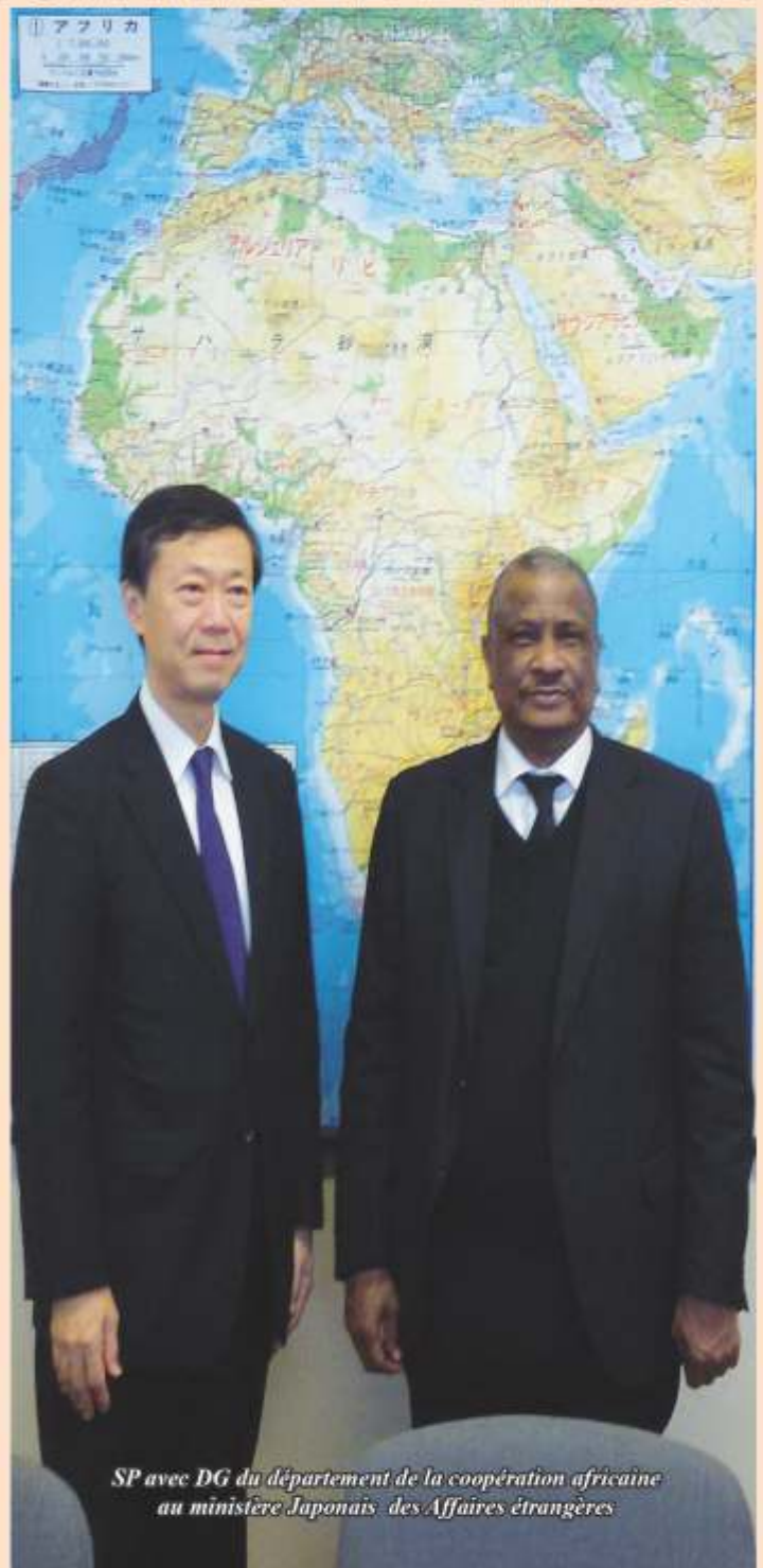
SP avec DG du département de la coopération africaine au ministère Japonais des Affaires étrangères

La déclaration de Tokyo a affirmé que le TEC contribue au renforcement de l'état de droit et à l'amélioration de l'environnement des entreprises dans le domaine de l'énergie, ainsi qu'à l'importance de promouvoir des investissements énergétiques appropriés et durables et des investissements dans les infrastructures de qualité. En outre, elle a affirmé des plans visant à renforcer les activités de sensibilisation pour inviter les nouvelles parties signataires de la Charte internationale de l'énergie et les nouveaux participants à l'ECT, reconnaissant que la valeur croissante du TEC rend important l'élargissement géographique du processus de la Charte de l'énergie.