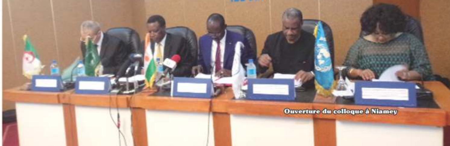
Ouverture du colloque à Niamey