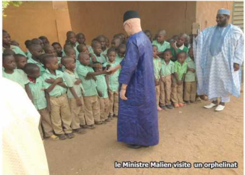
le Ministre Malien visite un orphelinat

Aujourd'hui cette lutte contre le terrorisme, nous en sommes acteurs, nous en sommes aussi victimes mais en réalité quand vous regardez les causes profondes ça vient de l'occident. Il faut que les occidentaux appuient nos Etats parce que nos Etats avaient des besoins fondamentaux prioritaires : l'école la santé; l'éducation. Aujourd'hui on est obligé