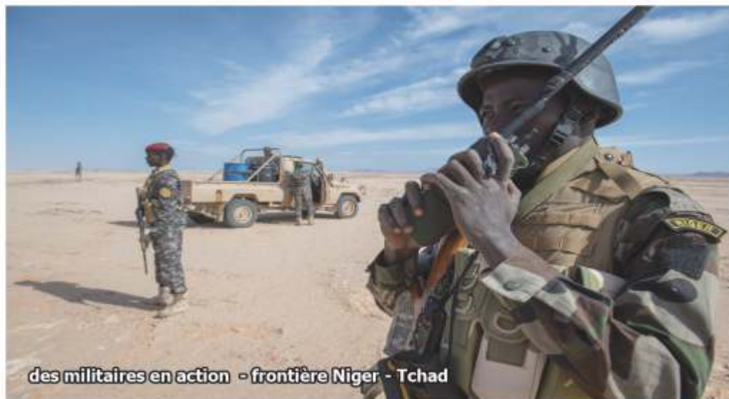
des militaires en action - frontière Niger - Tchad

Opération tripartite majeure, "Michi" a engagé deux compagnies nigérienne et tchadienne ainsi qu'un détachement de liaison et d'assistance opérationnelle (DLAO) de Barkhane, constitué autour d'un peloton de recherche et d'intervention (PRI) renforcé en provenance de Madama. L'ensemble était appuyé par les moyens aériens de Barkhane. Au total,