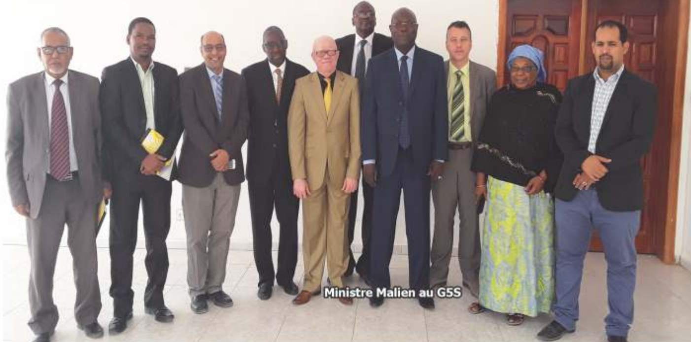
Ministre Malien au G5S