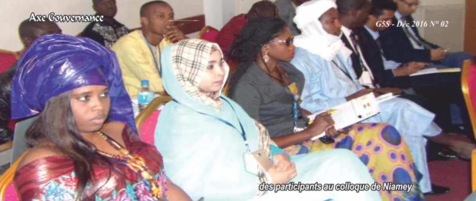
des participants au colloque de Niamey