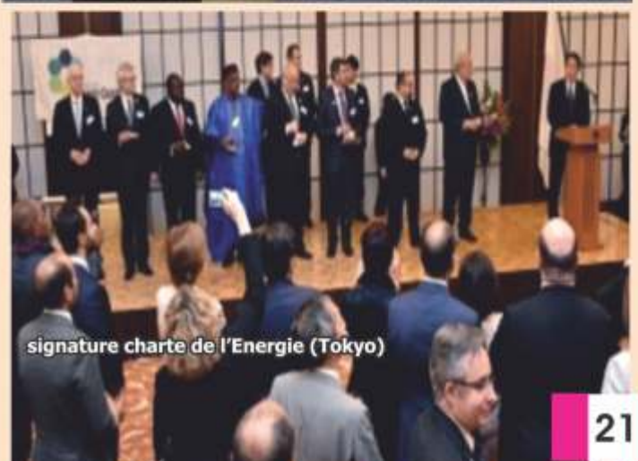
signature charte de l'Énergie (Tokyo)