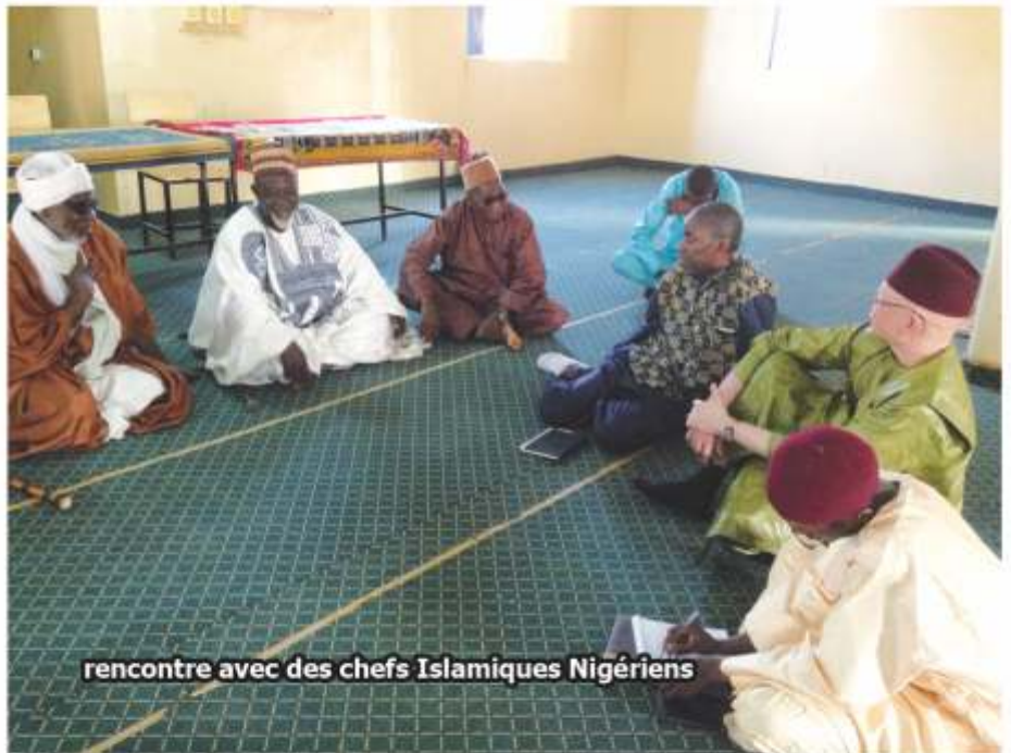
rencontre avec des chefs Islamiques Nigériens

d'abandonner tout cela ; ou de réduire pour aller à la lutte contre le terrorisme et le radicalisme.