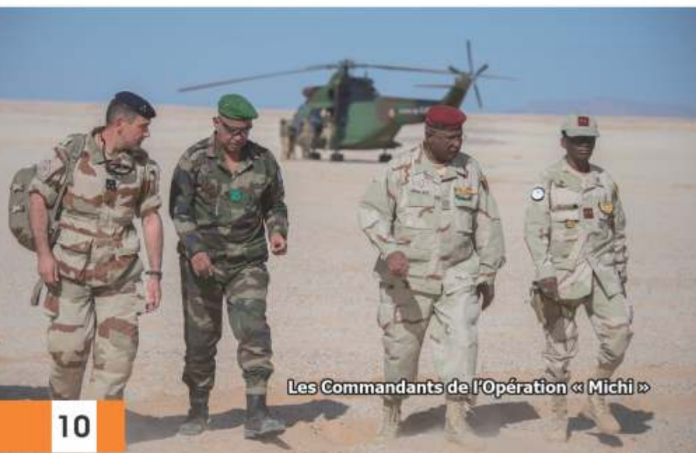
Les Commandants de l'Opération « Michi »

L'OMCT "Michi" a notamment permis l'interception par l'armée nigérienne de deux pick-up transportant des migrants illégaux et des orpailleurs le 19 novembre, ainsi que la neutralisation de mines et munitions découvertes le 21 novembre à proximité de la frontière tchadienne. Elle est ainsi venue confirmer la pertinence du mode d'action des OMCT, consistant à mener des opérations de contrôle dynamiques et coordonnées, centrées sur les corridors de mobilité des trafiquants et des groupes terroristes dans les zones transfrontalières. Conduite par les armées françaises, en partenariat avec les pays du G5 Sahel, l'opération Barkhane a été lancée le 1er août 2014. Elle repose sur une approche stratégique fondée sur une logique de partenariat avec les principaux pays de la bande sahélo-saharienne (BSS) : Mauritanie, Mali, Niger, Tchad et Burkina-Faso. Elle regroupe environ 4 000 militaires dont la mission consiste à appuyer les forces armées des pays partenaires dans leur action de lutte contre les groupes armés terroristes.