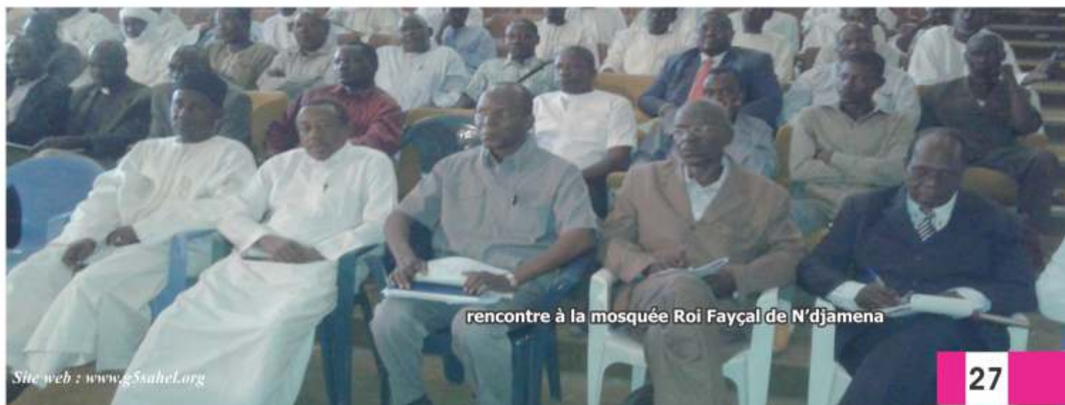
rencontre à la mosquée Roi Fayçal de N'djamena

Ceux de mon âge me comprendront certainement. Je suis fier de mon pays et de tous ses croyants aujourd'hui ! Que Dieu les bénisse.