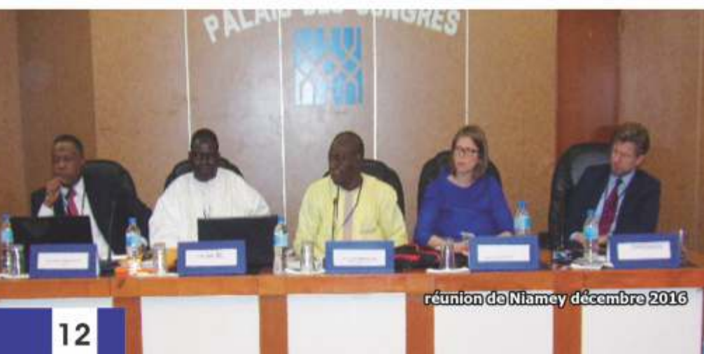
réunion de Niamey décembre 2016

Conscient de cette situation, le G5 Sahel avant même sa création officielle, a entrepris avec l'aide de certains de ses partenaires, quelques actions qui s'inscrivent dans sa vision des réponses innovantes à apporter au phénomène de l'insécurité dans le Sahel. à titre d'illustration on peut signaler le Projet " Développement d'Initiatives Intégrées pour la Jeunesse ", la Cellule Régionale de lutte contre la radicalisation, le projet d'Etude pour la formulation de la Stratégie Intégrée des Jeunes du G5Sahel. Pour bien comprendre le lien de complémentarité entre le volet défense et sécurité et les trois autres axes retenus par la Stratégie pour le Développement et la Sécurité (SDS) du G5 Sahel, il importe de rappeler l'importance accordée à ces derniers par le Programme d'Investissements Prioritaires : - le volet Infrastructures qui représente en termes de montants à investir plus de 70% du PIP, permet de contribuer à l'amélioration des conditions de vie des populations vulnérables en favorisant leur accès aux opportunités économiques et sociales : - le volet Résilience contribue au renforcement de la résilience des communautés vivant dans les zones transfrontalières enclavées et exposées aux effets néfastes du changement climatique.