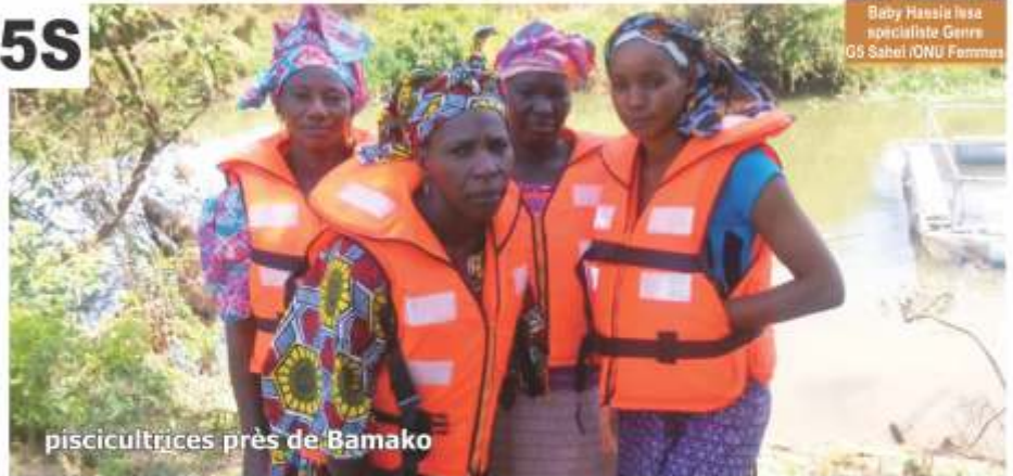
piscicultrices près de Bamako

Le G5 Sahel a comme priorité la prise en compte des femmes et du Genre dans toutes ses actions initiatives/stratégies compris Programme d'Investissements Prioritaires. C'est dans ce cadre que le G5 Sahel et ONU FEMMES ont signé un Mémoire d'Entente dont l'objectif vise entre autre à apporter un appui technique à travers l'affectation d'une spécialiste Genre qui a aussi pour mandat de promouvoir le processus de l'opérationnalisation de la Plateforme des femmes du sahel.