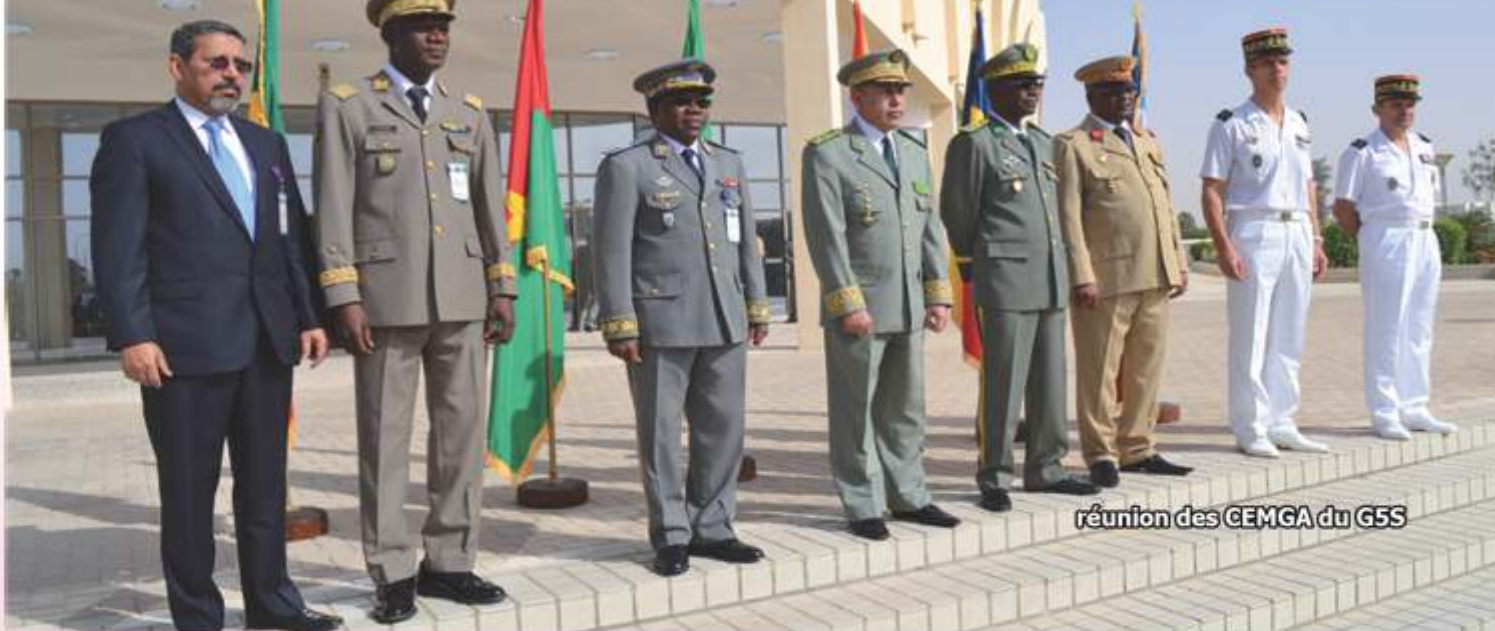
réunion des CEMGA du G5S

Ainsi une force antiterroriste serait constituée, équipée et entraînée pour les circonstances sous l'appellation de (GAR, GSI, ou Modules) et la structure classique de référence des Unités serait préservée. Il va de soit que d'importantes mesures d'accompagnement incitatives seraient nécessaires. Le Renseignement, étant le support fondamental de cette force; les moyens humains, techniques ainsi que les reconnaissances aériennes et de satellites doivent être permanents et combinés.